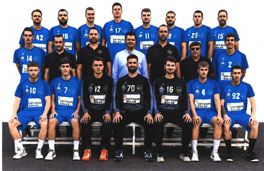
4. ábra NBI/B csapatkép 2023/2024

Fontos kiemelnem, hogy egyre több kritériumnak (MKSZ klublicenc) kell megfelelni ahhoz (pénzügyi, jogi, személyi, szakmai és infrastrukturális feltételek), hogy tovább folytathassuk jelen osztályban való szereplésünket.