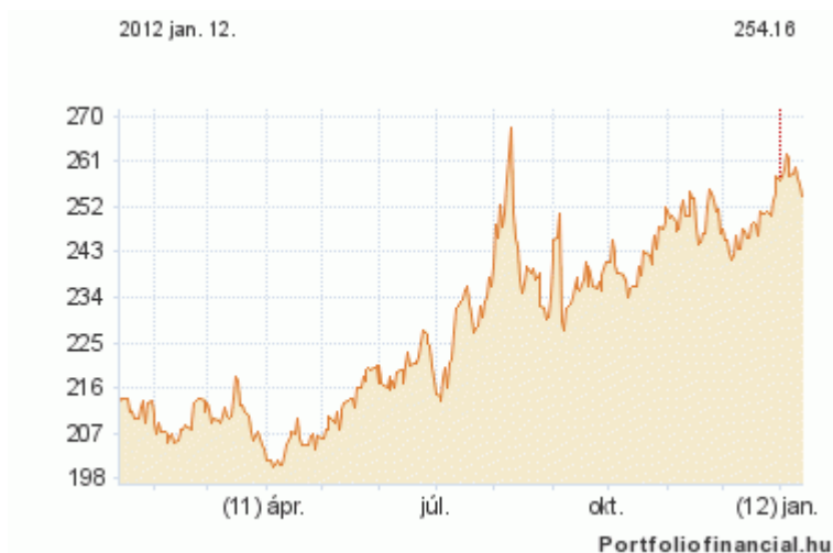
EUR/HUF 2011 Q3