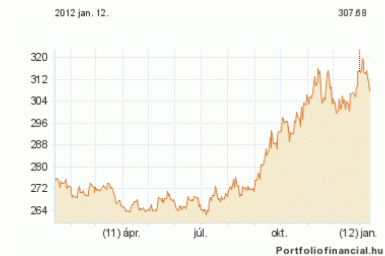
EUR/CHF 2011 Q3