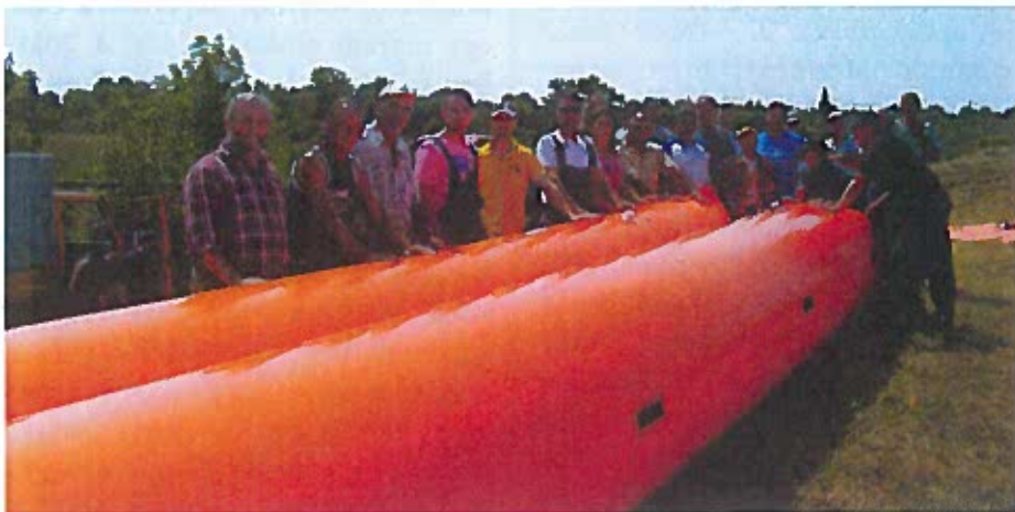
Képünkön az árvízvédelem új eszköze, a tömlős gát látható

Megalakult a „Békés Települési Önkéntes Mentőcsoport” 13 fővel. Az önkéntes mentőcsoport a speciális gyakorlat elvégzésével az alapvető vízkár-elhárítási tevékenység szakterületekre vonatkozóan 2016. május 28-án Nemzeti Minősítő oklevelet szerzett.