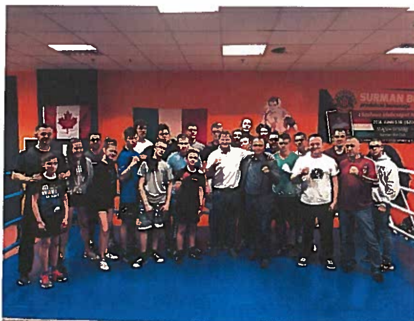
1. ábra Erdei Zsolt és a csapat

2018 februárjában, Erdei Zsolt, a Magyar Ökölvívó Szakszövetség elnöke látogatást tett nálunk. Elnök Úrral különböző szakmai egyeztetést folytattunk a jövővel kapcsolatban. A képen, csapatunk egy része és Erdei Zsolt elnök Úr.