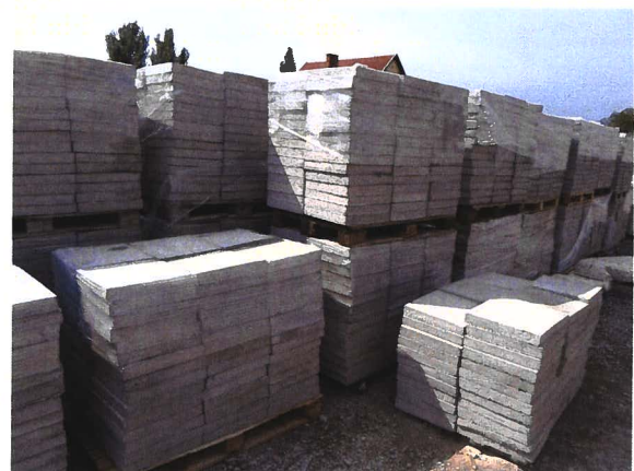
Kép: betonelem gyártása, osztályozása, raklapra pakolása