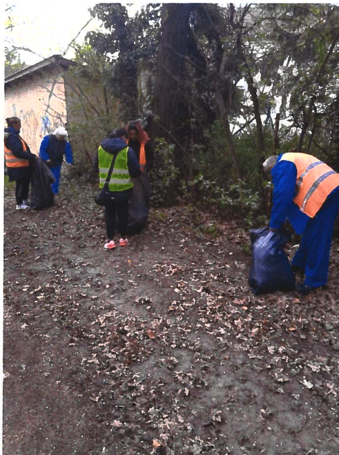
Kép: illegális (elhagyott) hulladék gyűjtése a Május 1. Park környékén

A megfelelő belvív-elvezetés biztosítása komoly feladat, ennek során az árkok takarítása, karbantartása folyamatos munkát igényel. A szélsőséges időjárás miatt alkalmasszerűen hirtelen megnőhet a belvízzel nagy mértékben veszélyeztetett területek nagysága. Egyre fontosabbá válik a védekezési tevékenység helyett a helyi vízkárok megelőzése érdekében tett lépések előtérbe helyezése. Békés város közigazgatási területén közel 200 km belvízelvezető található, amelyek folyamatos tisztítása szükséges, az esetleg bekövetkező károk elhárítása érdekében.