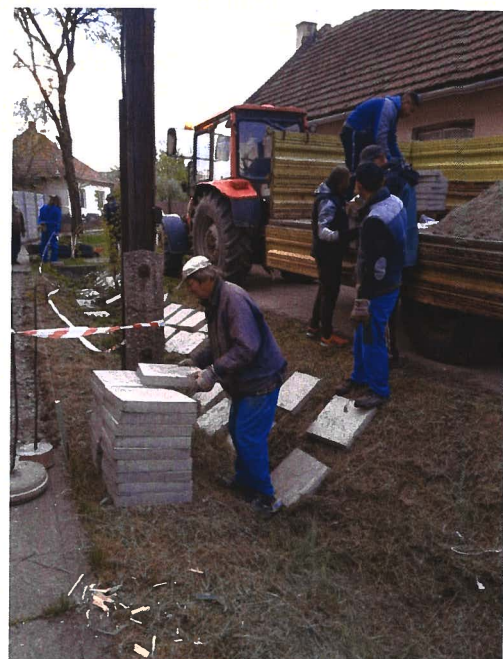
Kép: Raktár utca járdázása, illetve a Kasza utca – Bocskai utca sarkán monolit beton feltörése, tükrökészítés, járdalapok lerakása

A program során sajnos évek óta kénytelenek vagyunk rendszeresen létszámot biztosítani arra, hogy a város területén az elhagyott, illetve illegálisan lerakott hulladékot összegyűjtsük . Az elhagyott hulladék főként a város közterületeire jellemző, a másik nagy területet a városból kivezető forgalmas közutak jelentik, melyeket heti rendszerességgel jártunk be. A program során 14 tonna illegális hulladékot gyűjtöttünk össze, melyet a Békéscsabai Városüzemeltetési Kft.-hez szállítottunk ártalmatlanításra.