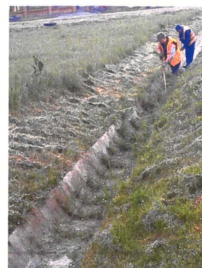
Kép: A Szánthó Albert utcában található belvízvédelmi szivattyú takarítása, illetve mederburkolt árok takarítása a Bartók-Béla utcában és a Gagarin utcában