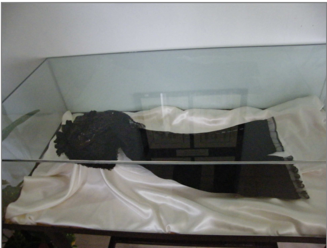
4. ábra A „nagyfőkötő”