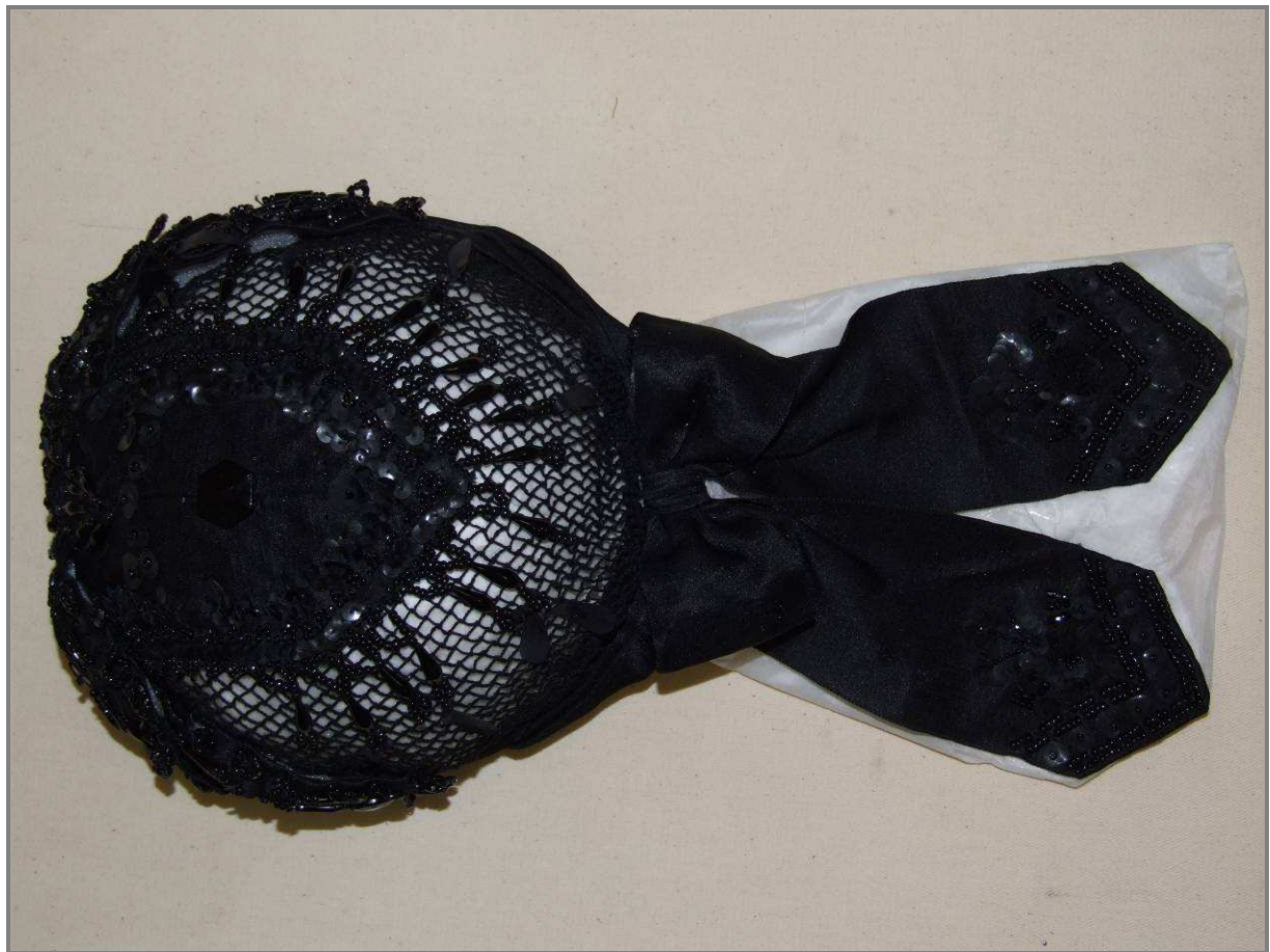
A TISZTÍTÁS, FORMÁRA IGAZÍTÁS VALAMINT A GYÖNGYÖK ÉS EGYÉB DÍSZÍTMÉNYEK MEGERŐSÍTÉSE UTÁNI KÉSZ ÁLLAPOT