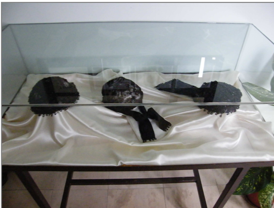
3. ábra A három kisebb, „gyöngyös főkötő”