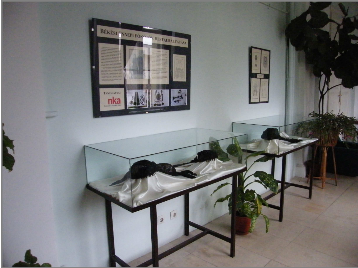
2. ábra A folyosótárlat