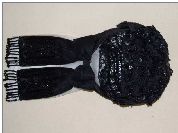
A KÉSZ ÁLLAPOT