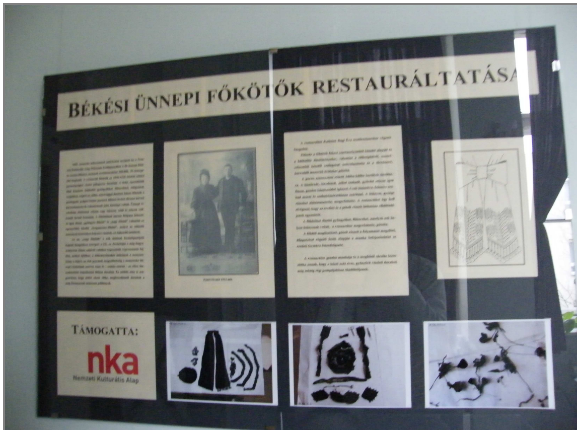
1. ábra Indítótábló

Időtartam: 2010. január10 – 2010. április 30.