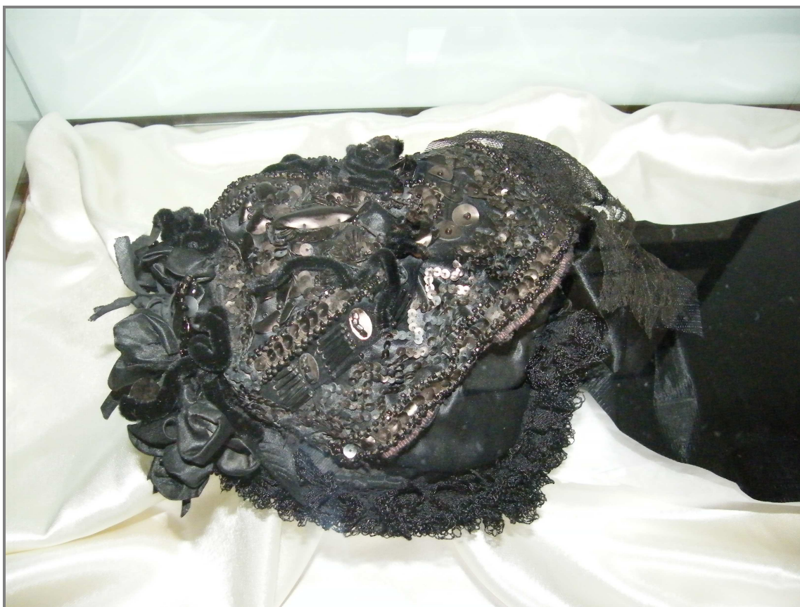
5. ábra A „nagyfőkötő” részlete