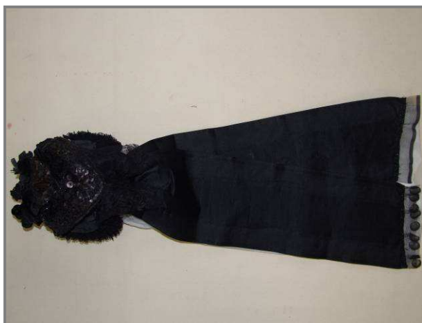
A KÉSZ FŐKÖTŐ