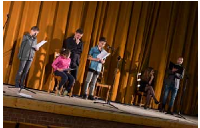
Rendhagyó irodalom óra a Jókai Színház színészeivel

6 millió forint támogatásban részesült, az Arany János Emlékbizottság döntése értelmében, a békési önkormányzat ebben az évben. Iskolákban, kulturális központban, könyvtárban megtartott programok, illetve Arany János emlékhelyekre szervezett kirándulások szerepeltek a repertoárban.