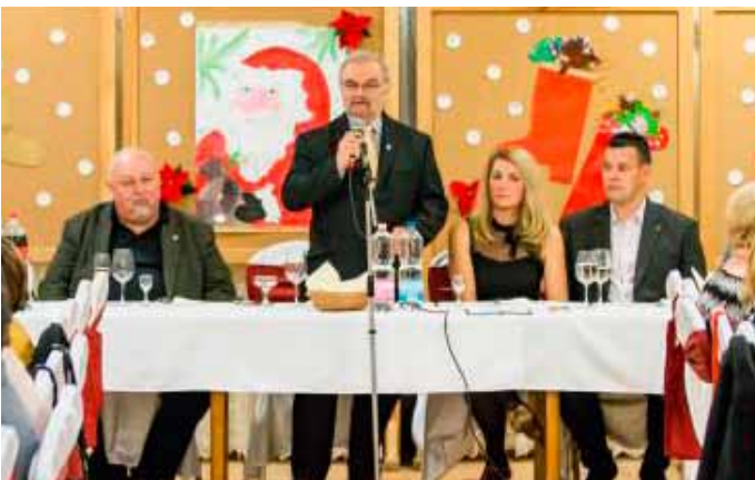
Az intézmény évváró rendezvénye

Izsó Gábor polgármester kiemelte, hogy az önkormányzat egyik legnagyobb létszámát foglalkoztató szervezete az intézet. A békési egészségügy infrastruktúrájának fejlesztése mellett az ott dolgozók megbecsültsége ugyan úgy fontos a városvezetés számára, mint a betegellátás korszerű környezetének kialakítása. Külön öröm, hogy a szakdolgozók béremelését támogatta a kormány. Ezen felül az önkormányzat 300 millió forint uniós forrásból korszerűsíti a rendelőintézet épületét.