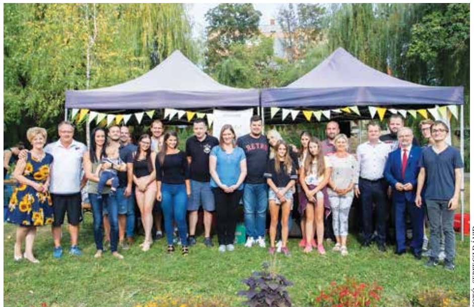
A Madzagfalvi Napokon harmadszor rendezték meg a fiatal békésiek és elszármazott fiatal békésiek találkozóját, a felvétel ekkor készült.

násával szeretnénk elérni, hogy a fiatalok első kézből szerezzenek információt a munkavégzésről, a helyi jövedelmi viszonyokról, valamint értékes kapcsolati tőkére tehetnek szert. Ennek