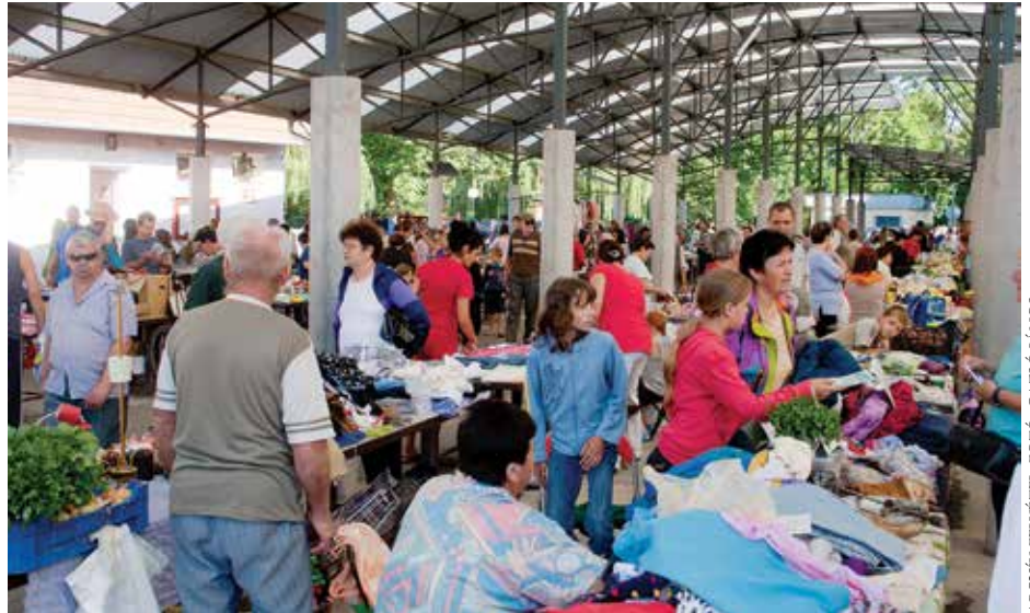
ARCHÍV FELVÉTEL. FOTÓ: GAZSÓ JÁNOS

A piac és vásár területére csak áru-feltöltést végző gépjárművel lehet behajtani. A gépjárműveknek az áru le- és felrakódása után, illetve legkésőbb a piac nyitását követő 1 órán belül a vásár és piac területét el kell hagyniuk, ezt követően kizárólag a piacfelügyelő enge-